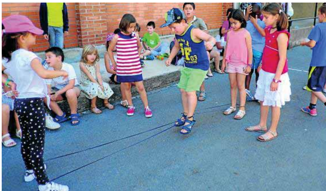
Juegos para todos. La convivencia ha mejorado en la escuela Dunboa de Irún (Gipuzkoa) desde que se aplica el plan de coeducación y los niños y niñas comparten juegos en el patio de recreo.