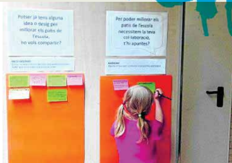
Participación. Una niña ofrece sus ideas para mejorar el patio de una escuela en Cataluña.